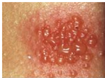
Sterk positieve plakproef