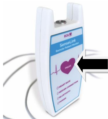
Afbeelding 2: eventknop om te drukken bij klachten

Hebt u erge klachten? Wacht niet tot het inleveren van de apparatuur, maar bel het ziekenhuis. Bij spoed belt u 112.