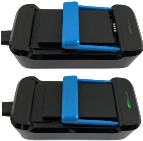
Afbeelding 5: onjuist geplaatste accu Afbeelding 6: volledig opgeladen accu

De oplader heeft een lampje en deze heeft de volgende betekenissen: