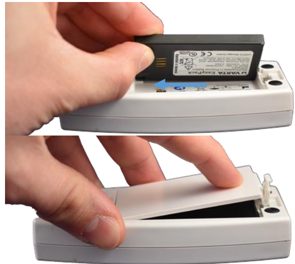
Afbeelding 3: correct verwisselen accu

Let op: voelt u dat het klepje niet goed dicht gaat? Controleer dan of u de accu er goed in hebt gedaan (zie afbeeldingen 3 en 4).