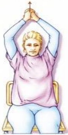
Figuur 6. Uw handen in elkaar vouwen. Daardoor wordt uw arm aan de geopereerde kant gesteund. Uw armen zo ver mogelijk gestrekt omhoog brengen.