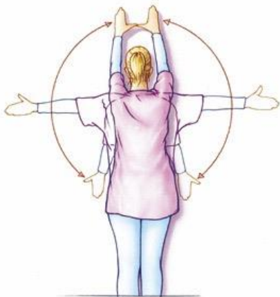
Figuur 8. Staande tegen de muur beide armen zijwaarts omhoog brengen, zo hoog u kunt. Uw handen blijven contact houden met de muur. U mag deze beweging ook in de vrije ruimte doen.