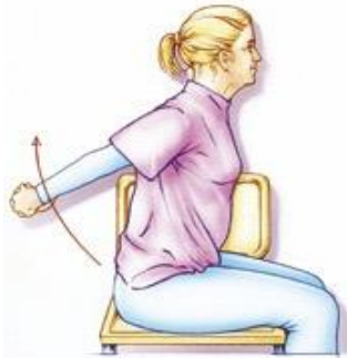
Figuur 5. Uw handen achter uw rug in elkaar houden. Vervolgens uw armen gestrekt omhoog brengen. Blijf rechtop zitten.