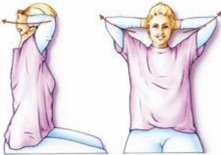
Figuur 4. Leg uw handen in de nek of in latere fase op uw achterhoofd, eventueel uw vingers ineengestrengeld. Houd uw ellebogen eerst ontspannen naar voren en breng ze daarna zo ver mogelijk naar achteren.