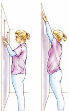
Figuur 7. Ga een stukje (15 cm) van de muur staan en "krabbel" met beide handen tegelijkertijd langs de muur naar boven. Als u de maximale hoogte bereikt hebt tilt u de hand van de muur.