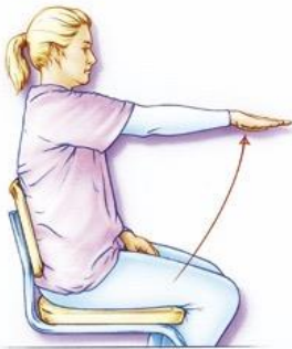
Figuur 2. Beweeg uw arm gestrekt voorwaarts. Ga niet verder dan schouderhoogte (dus tot maximaal 90 graden). Deze beweging mag ook zijwaarts tot schouderhoogte.