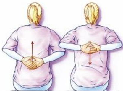
Figuur 3. Leg uw handen zo laag mogelijk op uw rug en schuif ze langs uw rug naar boven.