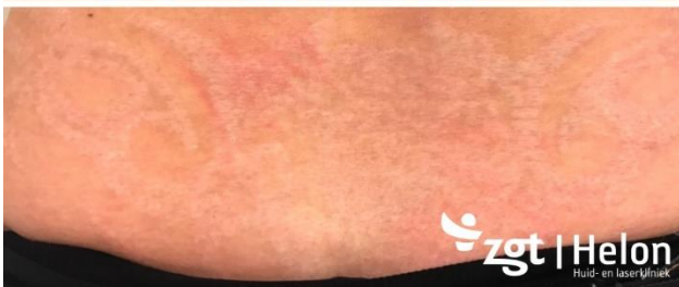
(Indicatie: tatoeage op onderrug. Resultaat na 7 behandelingen)